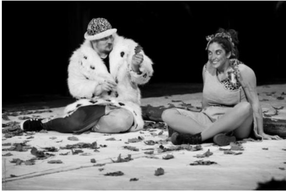
© B QUERARD Shakespeare – Comme il vous plaira – Pierre de Touche et Audrey (F. Louis et J. Allan)